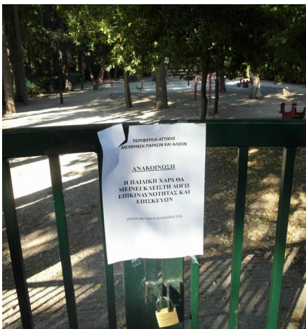
Εικόνα 6 Ανακοίνωση κλεισίματος της μικρής παιδικής χαράς στο Πεδίο του Άρεως. Οκτώβριος 2017. Επισημαίνεται πως δεν αναφέρεται χρόνος επαναλειτουργίας.

Το ενδιαφέρον είναι πως όλα αυτά συμβαίνουν σε αντίθεση με συγκεκριμένα έργα που προβάλλονται και θεωρούνται εμβληματικά, όπως η παιδική χαρά στο Ίδρυμα Σταύρος Νιάρχος ή η Τεχνόπολη του Δήμου Αθηναίων. Όσο καλής ποιότητας κι αν είναι όμως τα συγκεκριμένα έργα ή και πολλά ακόμα, συνεχίζει να αποτελεί πρόβλημα το γεγονός πως οι γονείς πρέπει να μπουν στο αυτοκίνητο και να κάνουν εκδρομή για να βρουν μια ωραία παιδική χαρά για να παίξουν τα παιδιά τους. Ας μην ξεχνάμε πως το ζητούμενο είναι να υπάρχουν καλές παιδικές χαρές - και δημόσιοι χώροι εν γένει - στις γειτονιές και όχι σε λίγα προβεβλημένα σημεία της πόλης.