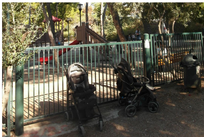
Εικόνα 7 Η μεγάλη παιδική χαρά στο Πεδίο του Άρεως ενώ είναι κλειστή κι αυτή λόγω "επικινδυνότητας και επισκευών". Ο χώρος παρ' όλα αυτά χρησιμοποιείται. Οι γονείς αφήνουν τα καρότσια έξω από την περίφραξη και μπαίνουν μέσα μαζί με τα παιδιά τους.

Κλείνοντας την εισήγηση γίνεται προσπάθεια να σκιαγραφηθεί μια πρόταση, με τους περιορισμούς και τις επιφυλάξεις που τίθενται από την περιορισμένη πρόσβαση σε δεδομένα σχετικά με διοικητικές διαδικασίες και δυνατότητες. Θέλουμε να πιστεύουμε πως ακόμα και μέσα στην κρίση, με τα περιορισμένα μέσα και πόρους, είναι δυνατό να οργανωθεί ένα πρόγραμμα αναμόρφωσης των υπαρχουσών παιδικών χαρών. Η αναμόρφωση μπορεί να γίνεται σταδιακά. Σε ένα βάθος χρόνου μπορούν σιγά σιγά να αναβαθμίζονται, να μεταφέρονται ή να αποκαθίστανται, χωρίς εκπτώσεις στις προδιαγραφές και τις ποιοτικές απαιτήσεις. Χρειάζεται ένα χρονοδιάγραμμα και μια μελέτη που να καθορίζει προτεραιότητες για το ποιες παιδικές χαρές είναι άμεσα αναγκαίο να αναβαθμιστούν και ποιες λιγότερο. Το σημαντικό που είναι απαραίτητο να τονιστεί είναι πως μια κακή παιδική χαρά που δεν χρησιμοποιείται είναι δυσφήμιση για έναν δήμο. Είναι στο χέρι όλων των ενδιαφερομένων να το καταστήσουν αυτό σαφές.