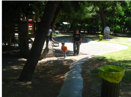
Εικόνα 2 Παιδική χαρά Ζαπείου. Καλοκαίρι 2014. Παρά την απαγόρευση παιδιά και συνοδοί παίζουν κανονικά. Ενδιαφέρον παρουσιάζουν οι σακούλες στους κάδους, ένδειξη πως η πολιτεία συνεχίζει και φροντίζει για την καθαριότητα και άρα τη λειτουργία των χώρων.

Οι παιδικές χαρές όφειλαν να περάσουν μια διαδικασία ελέγχου η οποία θα γίνονταν με βάση την πρόσφατα θεσμοθετημένη υπουργική απόφαση 28492/2009 (ΦΕΚ 931 Β 18/5/2009) που αποτελούσε και συνεχίζει να αποτελεί την πρώτη συνολική νομοθεσία σχετικά με τη λειτουργία των παιδικών χαρών. Η νομοθεσία αυτή απέχει πολύ από το να είναι τέλεια, κάτι που θα σχολιαστεί στο δεύτερο μέρος της εισήγησης. Παρόλα αυτά επιχειρεί να οριοθετήσει ζητήματα χωροθέτησης, καταλληλότητας, ασφάλειας, λειτουργίας, συντήρησης και ελέγχου των παιδικών χαρών.