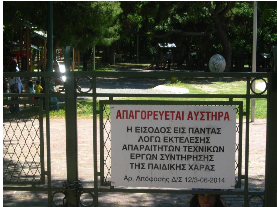
Εικόνα 1 Παιδική χαρά Ζαπείου στην Αθήνα. Καλοκαίρι 2014. Η ταμπέλα απαγόρευσης εισόδου, χωρίς να αναφέρεται χρόνος επαναλειτουργίας.

Οι διαδοχικές ενέργειες της πολιτείας με αφορμή το συγκεκριμένο περιστατικό παρουσιάζουν ενδιαφέρον. Η πρώτη αντίδραση, αμέσως μετά το ατύχημα, θα μπορούσε να συνοψισθεί στη γνωστή φράση “πονάει κεφάλι-κόψει κεφάλι”. Σε πολλές παιδικές χαρές, εμφανίστηκαν ταμπέλες που “απαγόρευαν αυστηρά την είσοδο εις πάντας”, μέχρις ότου οι συγκεκριμένες παιδικές χαρές περνούσαν τη διαδικασία συντήρησης. Επρόκειτο για μια ενέργεια με δυσκολίες στην εφαρμογή της, καθώς η αναγκαιότητα των παιδιών και των γονέων να χρησιμοποιήσουν τις παιδικές χαρές δεν μπορούσε εύκολα να ελεγχθεί. Για αρκετόν καιρό εμφανίζονταν το αστείο θέαμα οι πόρτες των παιδικών χαρών να είναι κλειστές, οι ίδιες οι παιδικές χαρές, όμως, να είναι γεμάτες με παιδιά και συνοδούς που απλά καβάλαγαν τις μάντρες και χρησιμοποιούσαν την παιδική χαρά (Εικόνα 1 και 2). Το κλείσιμο των παιδικών χαρών ήταν μια εύκολη και ανώδυνη λύση που απάλλαζε την πολιτεία από τις ευθύνες της, μετατοπίζοντας την επαναλειτουργία των παιδικών χαρών και άρα την επίλυση του προβλήματος σε ένα ασαφές μέλλον. Σπάνια αναφέρονταν στις πινακίδες ο χρόνος επαναλειτουργίας του χώρου.