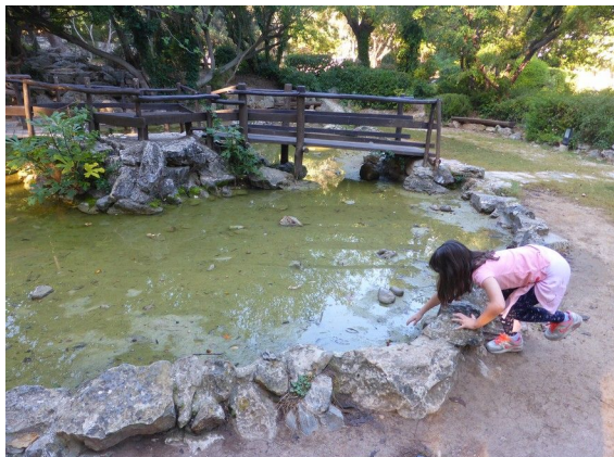
Εικόνα 3 Παιδική Χαρά του Πικιώνη, στη Φιλοθέη. Ένα παιδί παίζει στη λιμνούλα.